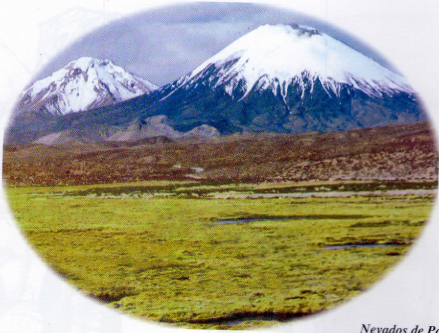
Nevados de Pachayata