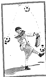
Ilustración de cubierta: JUAN RAMÓN ALONSO

Karli pierde a sus padres y es educado por su abuela. Tanto Karli como la abuela tienen que cambiar para adaptarse y convivir sin tensiones. Pero vencen las dificultades y acaban siendo muy buenos amigos. Este libro recibió el Deutscher Jungedbuchpreis en 1976.